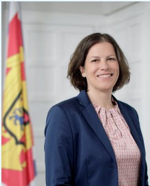
Kristina Herbst Präsidentin des Schleswig-Holsteinischen Landtags